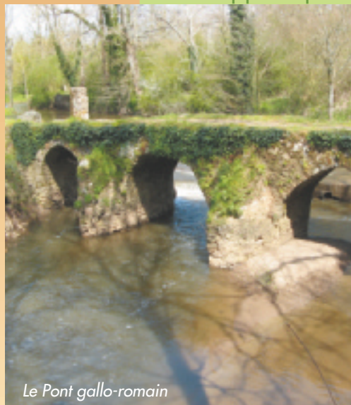
Le Pont gallo-romain

Syndicat Mixte du SCot et du Pays du Vignoble Nantais www.vignoble-nantais.eu