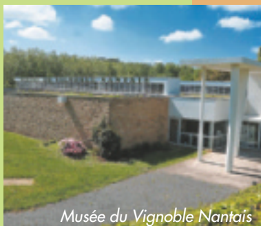
Musée du Vignoble Nantais

Exposition d'outils viticoles anciens, films sur les techniques de vendanges et de vinification, dégustations. Visite-jeu « Oh LA L.A. ! Quelle aventure ! » proposé aux enfants de 6 à 12 ans pour découvrir le site en s'amusant. Tél. : 02 40 80 90 13.